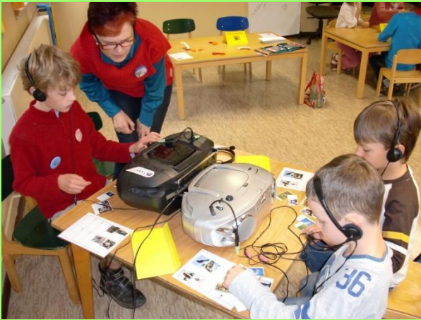
Ohrenspitzer - CDs